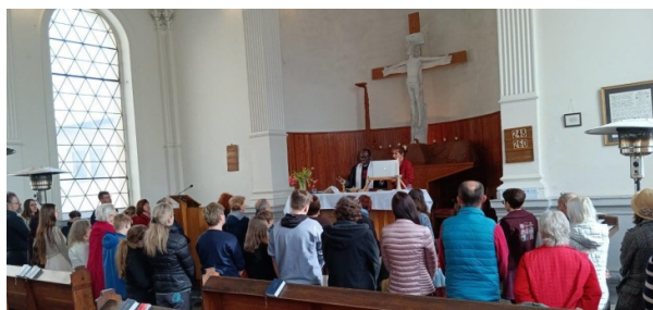
Velikonoční neděle – Večeře Páně