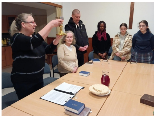
Zelený čtvrtek – připomínka Večeře Páně

29.–31. 3. – velikonoční svátky (Čt: připomínka Večeře Páně, Pá: čtení paší, So: sederová večeře ve Slaném, Ne: bohoslužba)